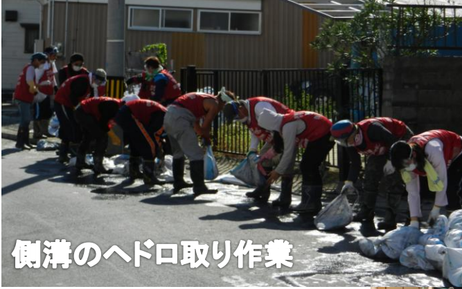
側溝のヘドロ取り作業