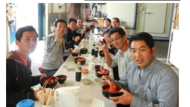
◆復興を果たした塩釜港で食事を探りました。